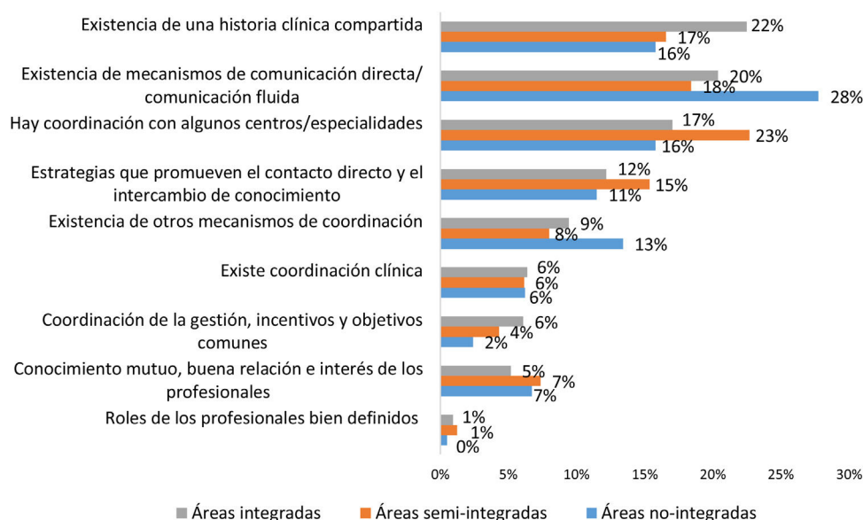
Figura 1. Motivos de una percepción de coordinación positiva en el territorio según la gestión de la atención primaria y especializada.