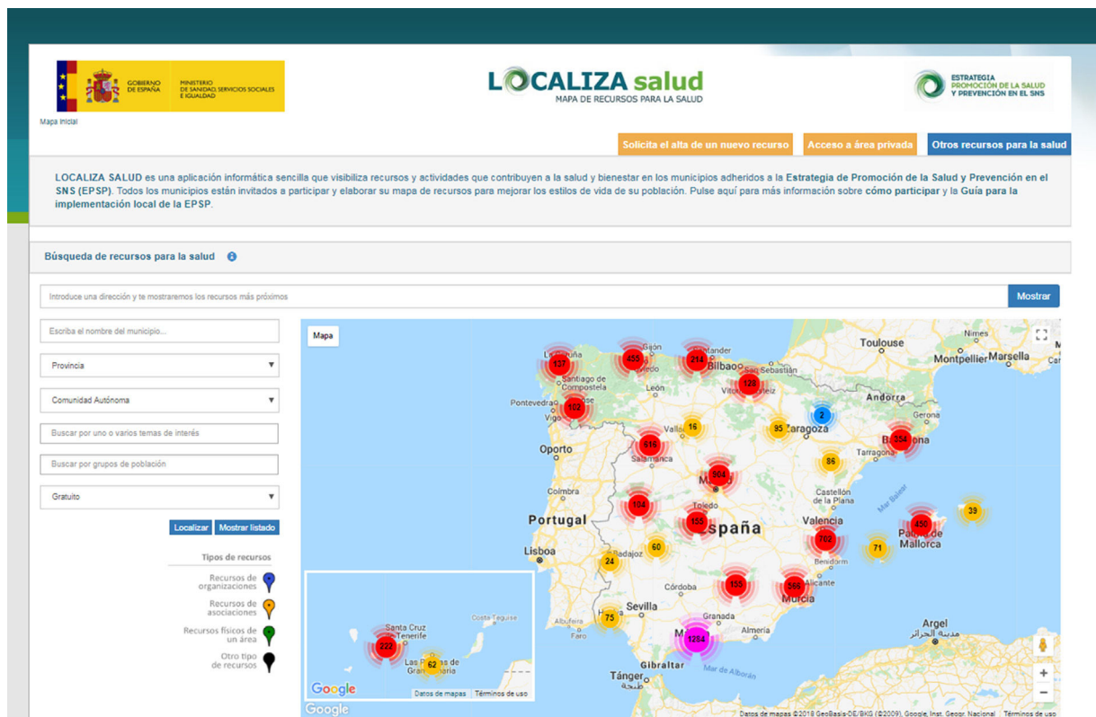
Figura 1. Mapa de recursos para la salud.