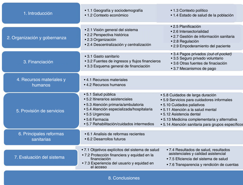
Figura 4. Estructura estandarizada de contenidos de los informes Health in Transition (HiT).