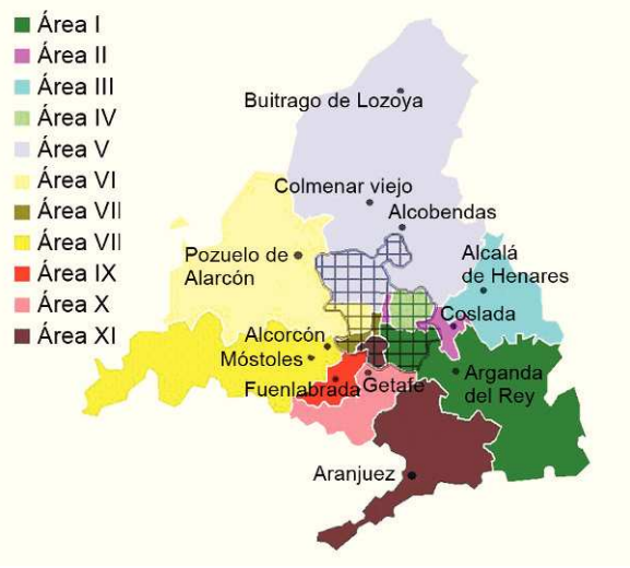
Figura 2. Distribución por áreas sanitarias. Mapa sanitario de la Comunidad de Madrid.

el tamaño medio del hogar (número de miembros que componen la unidad familiar). Todos ellos se obtuvieron del Instituto de Estadística de la Comunidad de Madrid 18 , salvo los datos de renta de la ciudad de Madrid, que se obtuvieron de la Dirección General de Estadística de este ayuntamiento 19 .